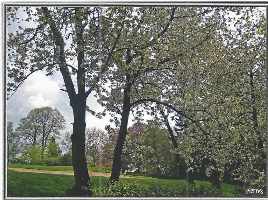
boom welke bloeit voordat er bladeren komen